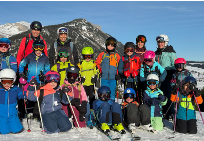
Skitag in Wildhaus