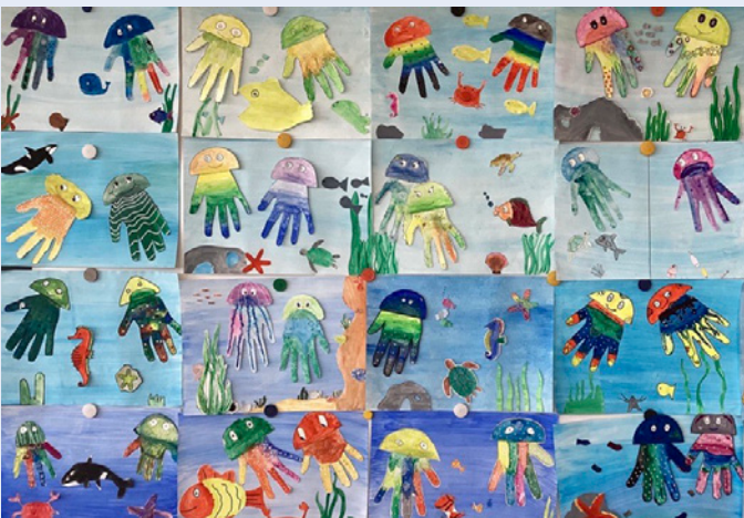
Unterwasserwelt – kreativ gestaltete Handabdrücke