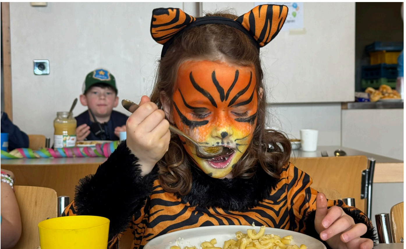
Fütterung der Raubtiere