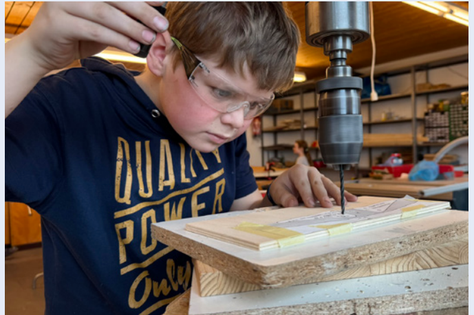
Ganz vertieft in die Arbeit