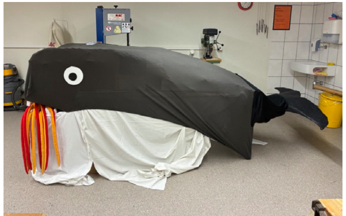
Der Orca ist bereit für den Umzug