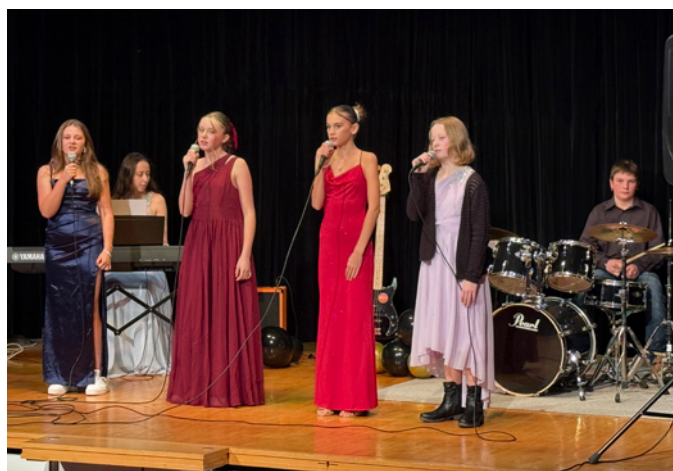
Grosser Auftritt am Weihnachtsball