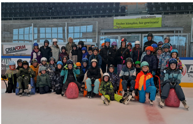
Aufs Glatteis gewagt