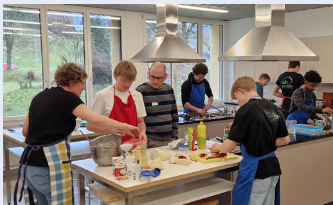
Im WAH-Unterricht wird das Essen für die Gäste vorbereitet

Die Pause um zehn Uhr kann im Teamzimmer gemeinsam mit dem Lehrkörper verbracht werden. Dort entsteht ein erster ungezwungener Austausch zwischen Gästen und Lehrpersonen.