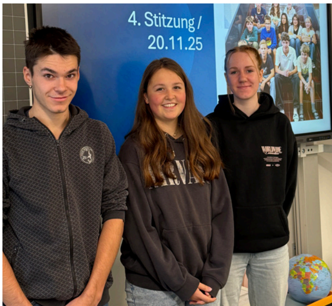
Ein Zungenbrecher: Schülerratspräsidentschaftstrio

Im Februar 25 übernahmen wir das Amt und die Aufgaben der Schülerratspräsidentschaft. Wir teilten uns dieses Amt zu dritt auf. Wir waren sehr gespannt darauf, was in dieser Zeit auf uns zukommen würde.