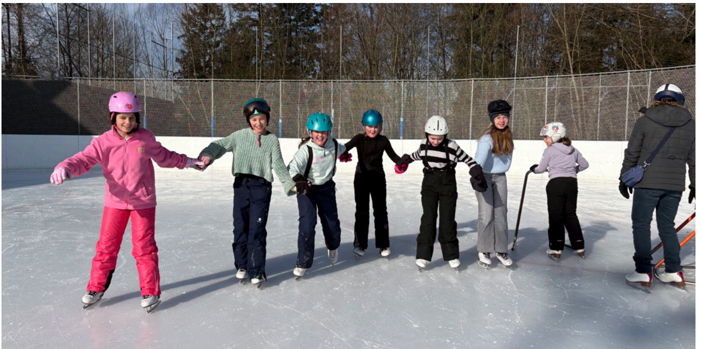
Du entwischst uns nicht!