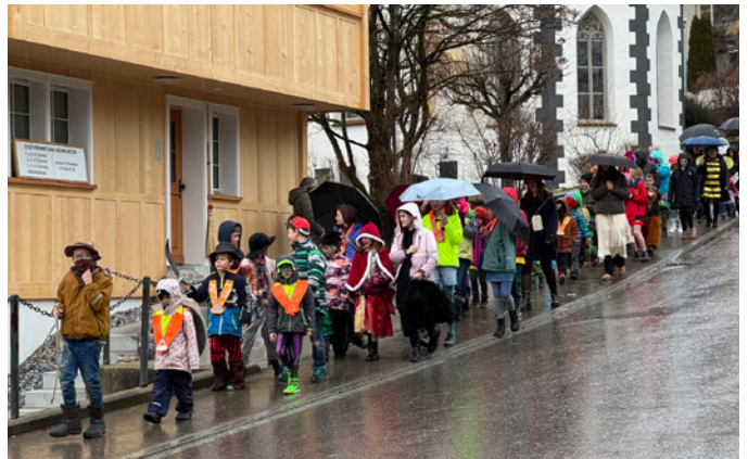
Umzug im Regen