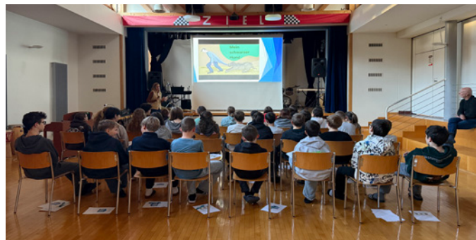
Die 1. OS am Infoanlass zur psychischen Gesundheit

Aus diesem Grund fand für die Schülerinnen und Schüler der 1. Oberstufe ein Informationsanlass zum Thema psychische Gesundheit statt. Ziel war es, Wissen zu vermitteln, Vorurteile abzubauen und den Jugendlichen Orientierung zu geben. Thematisiert wurde unter anderem, wie psychische Erkrankungen entstehen können, wie sich eine Depression äussert, welche Hilfsangebote es gibt und was jede und jeder Einzelne zur eigenen psychischen Gesundheit beitragen kann.