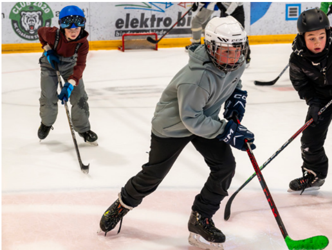
Voller Einsatz beim Eishockey