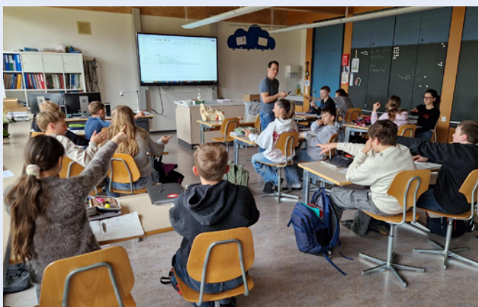
Einblick in eine NT-Lektion

09:05 Uhr Die Gäste haben die Möglichkeit, verschiedene Unterrichtssequenzen zu besuchen. Die Schulzimmertüren stehen dafür offen, sodass in einer Art Classroom Walk-through unterschiedliche Klassen und Lernsettings erlebt werden können.