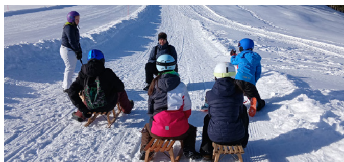
Auf den Schlitten, fertig, los!