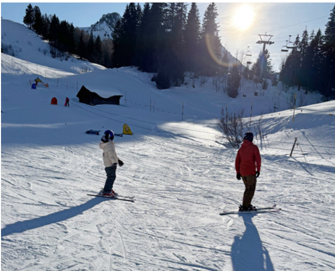
Auf der Piste