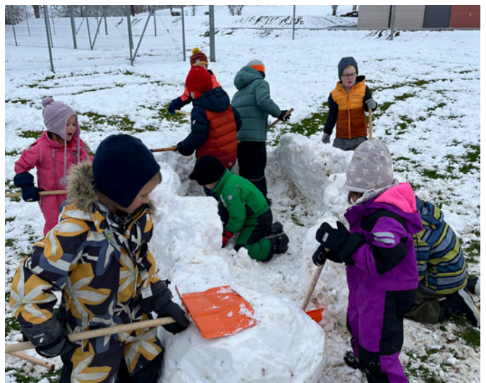
Spiel und Spass im Schnee