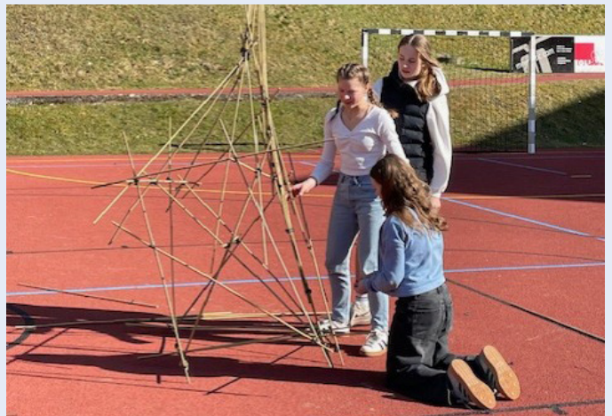
Unkonventionelle Lösungsansätze sind gefragt