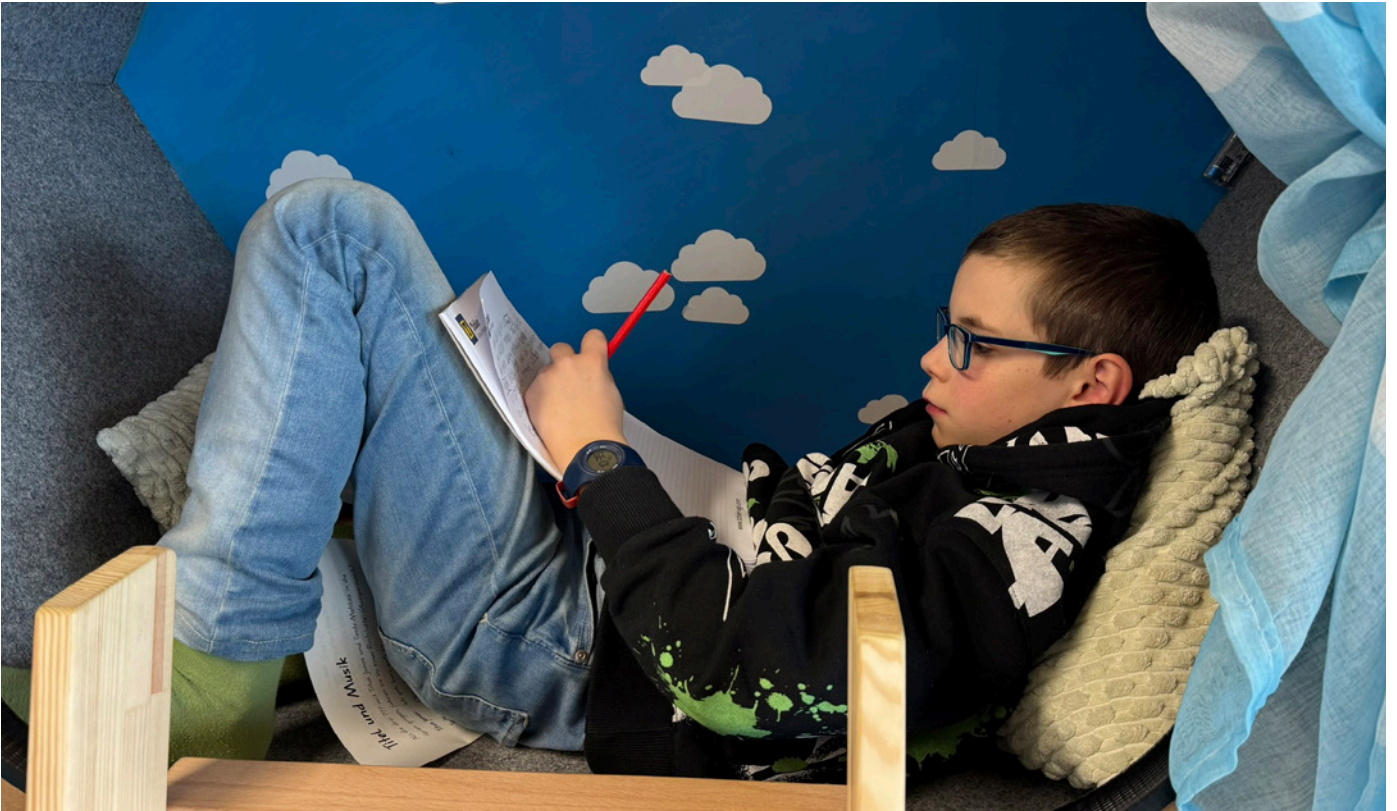
Schreiben geht in jeder Position