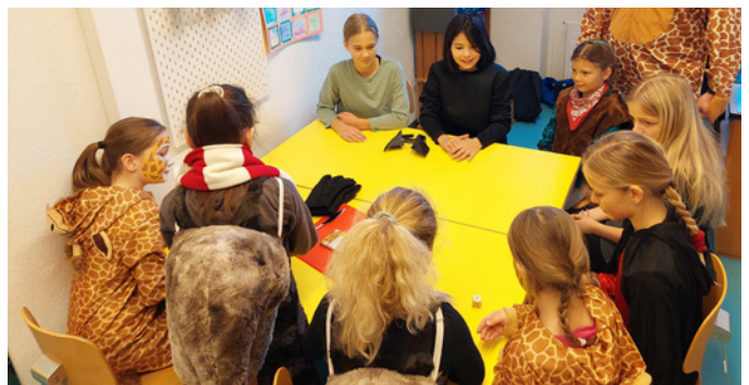
Würfelspiel am Fasnachtsmorgen