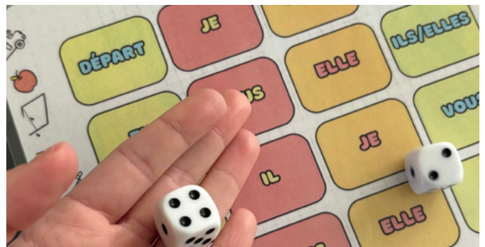
Les pronoms – quel plaisir!