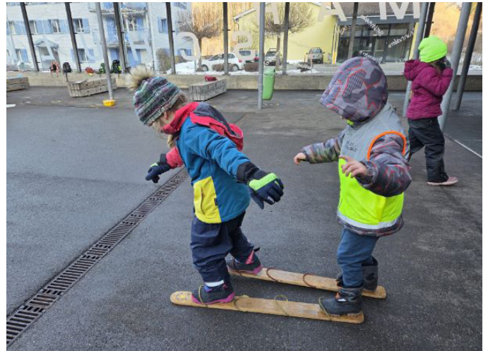
Wettlauf bei der Schnee-Olympiade

In verschiedenen Ateliers erfuhren sie nicht nur, welche Pinguinarten es gibt, wie gross diese werden können, wo sie vorkommen, welche Feinde sie haben, was sie fressen und wie sie ihre Jungen aufziehen, sondern es wurde auch gebastelt, gemalt und auf andere Art kreativ gewirkt. Jeder Tag begann mit einem gemeinsamen Einstieg, bei dem Pinguinlieder gesungen wurden und in kleinen Theater-