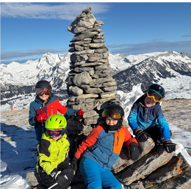
Pause beim Steinmannli