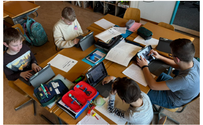
Den eigenen Interessen nachgehen