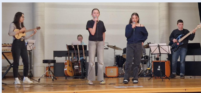
Musikalischer Auftakt durch die OZN-Band

08:15 Uhr Die Schülerinnen- und Schülerband begrüsst die Gäste mit einem musikalischen Auftakt.