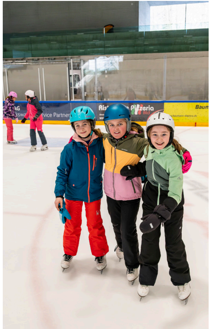
Zusammenhalten und nicht umfallen!