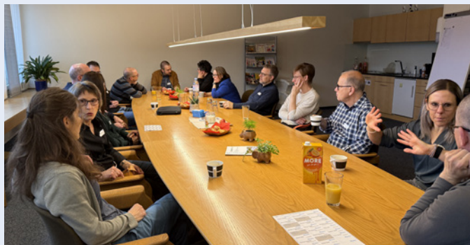
Einstieg in den Tag

08:00 Uhr Die Gäste – Mitglieder der Schulkommission, der Schulverwaltung sowie die Schulleitungen der anderen Neckertaler Schuleinheiten – treffen ein.