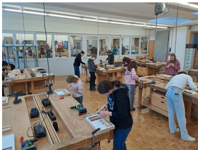
Wenn Konzentration hörbar wird