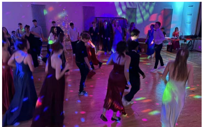
Ein beliebter Anlass ist der Weihnachtsball