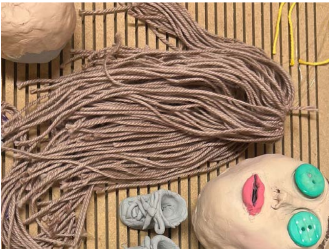
Die Puppengesichter nehmen Gestalt an