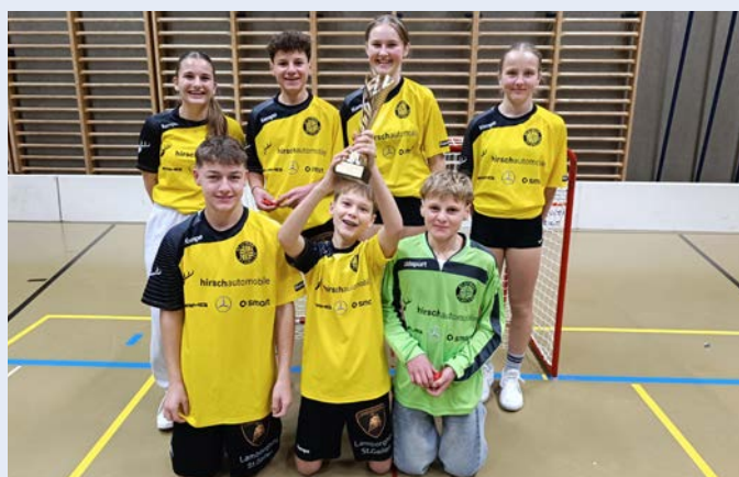
Die Siegermannschaft aus dem OZ Necker

Allen Beteiligten möchte ich hiermit einen grossen Dank aussprechen. Allen Sportlerinnen und Sportlern, aber auch allen Betreuerinnen und Betreuern, dem Elternrat Mogelsberg, welches wieder für Kaffee und Kuchen sorgte, den Samariterinnen, welche zum Glück nicht allzu viel zu tun hatten und den Schiedsrichtern, die einen souveränen Job machten.