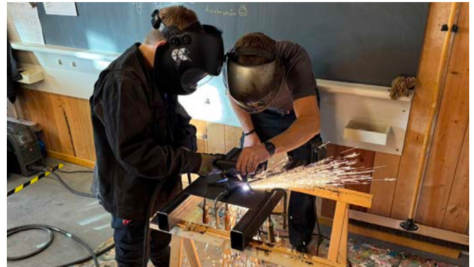
Plasmaschneiden, dass die Funken sprühen