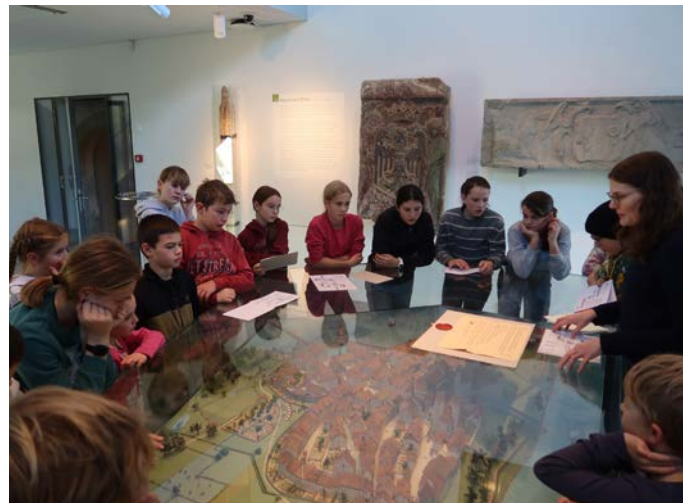
Spannendes über die mittelalterliche Stadt