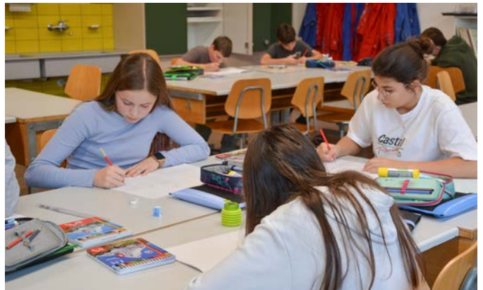
Bildnerisches Gestalten in der 2. Real