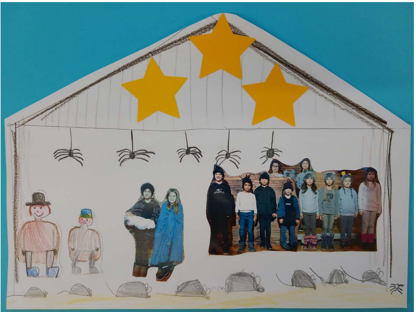
En Stall voll Müs und Spinne