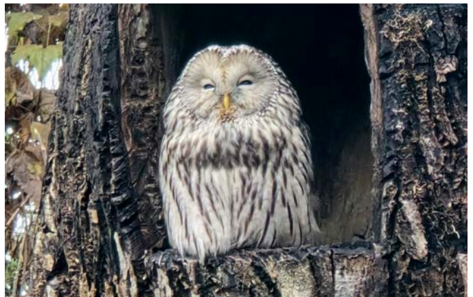
Ramon, 6. Klasse Faszinierende Ruhe und Übersicht