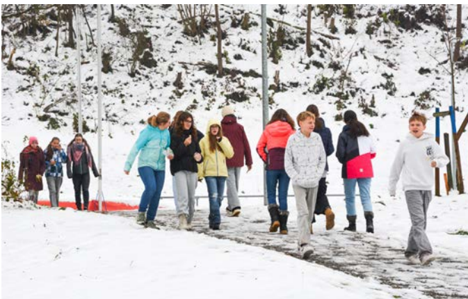
Viele Jugendliche drehen Runden um das Schulhaus