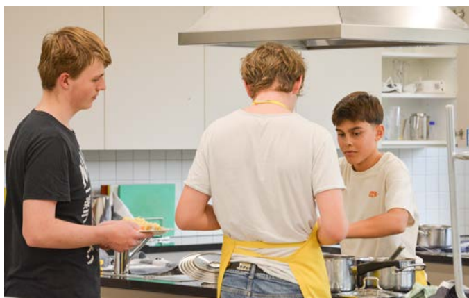
WAH-Unterricht der 3. Real in der Küche