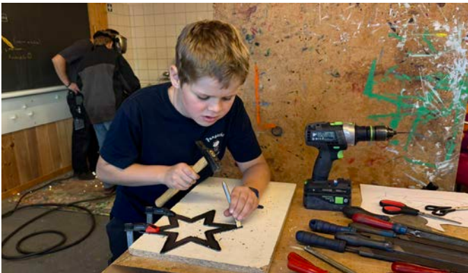
Auf die Details kommt es an