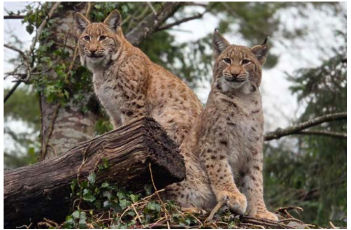
Man könnte den Luchsen stundenlang zusehen