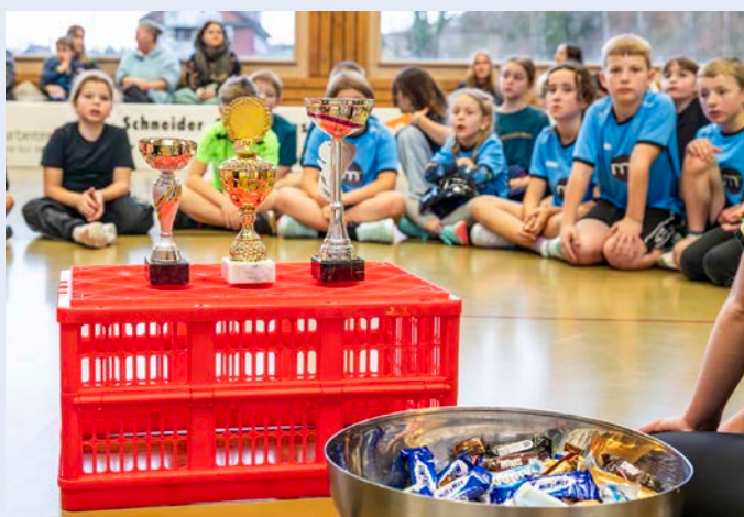
Alles bereit für die Rangverkündigung

Am späteren Nachmittag trafen sich dann die Schülerinnen und Schüler der 5. und 6. Klasse in der Halle und gaben alles, um am Schluss ganz oben auf dem Podest zu stehen. Diesmal revanchierte sich das obere Neckertal und die «Hemberg Wolves» schwangen mit beeindruckenden Leistungen obenaus.