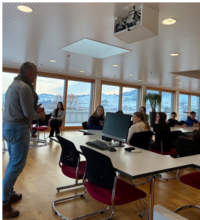
Besuch bei der Firma Blumer Fensterwerke AG in Waldstatt