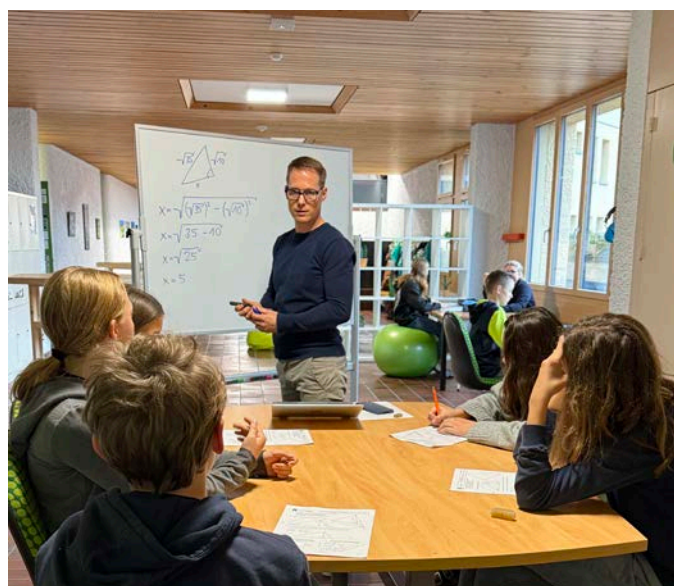
Mathe-Input im Niveau e der 2. OS