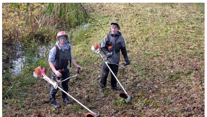
Outdoor-Einsatz der 3. OS beim Nudliweiher