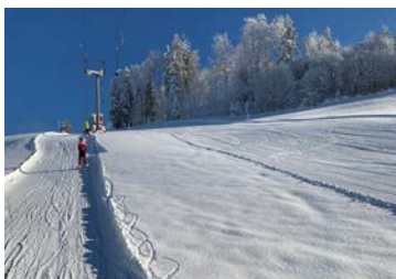
Coverbild: Yvonne Naef

Rosa Fäh und Sandra Fitzi redaktion@schuleneckertal.ch Druck: Schmid Mogelsberg AG Design: Sags GmbH, St. Gallen