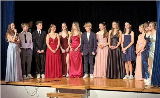
Das Weihnachtsballkomitee auf der Bühne