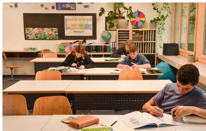
Ausdauerndes Üben in Mathe in der 3. OS