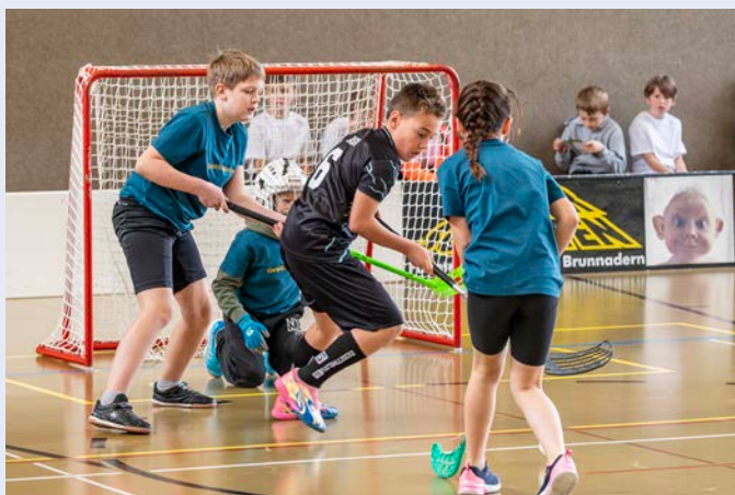
Mit vollem Einsatz

Bereits in den letzten beiden Jahren bewährte sich der Modus mit den getrennten Turnieren der beiden Kategorien. So fanden sich die jüngsten Teilnehmenden um 13.30 Uhr in der Halle ein, um mit- und gegeneinander den Sieg auszumachen. Mit Teams aus St. Peterzell, Oberhelfenschwil, Brunnadern, Hemberg und Mogelsberg war das ganze Tal vertreten. Sämtliche Entscheidungsspiele gingen äusserst knapp aus, wobei sich letztendlich «Die Kings» aus Mogelsberg den Turniersieg schnappten.