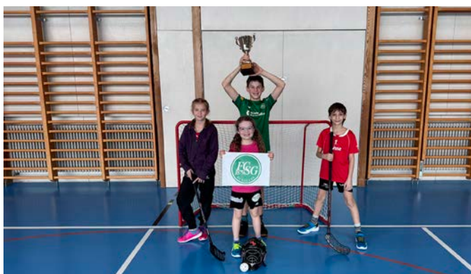
Die Siegermannschaft im Unihockey