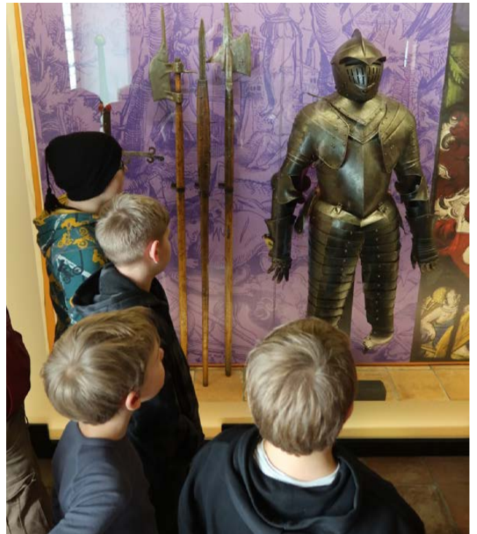
Die Ritterrüstung macht Eindruck