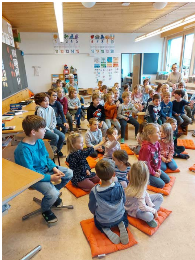
Gespannt lauschen alle Kinder der Geschichte