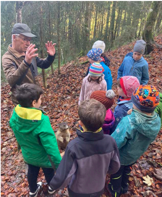
Ganz aufmerksam hören die Kinder zu