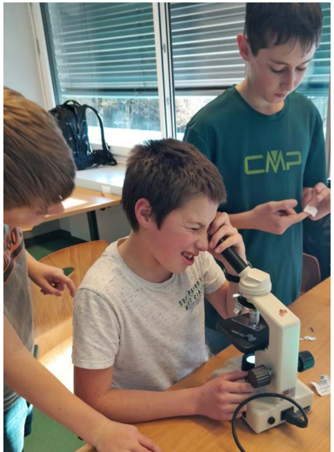
Unglaublich, was da zum Vorschein kommt!