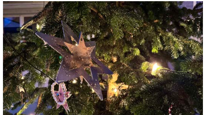
Unser vielfältiger Baumschmuck