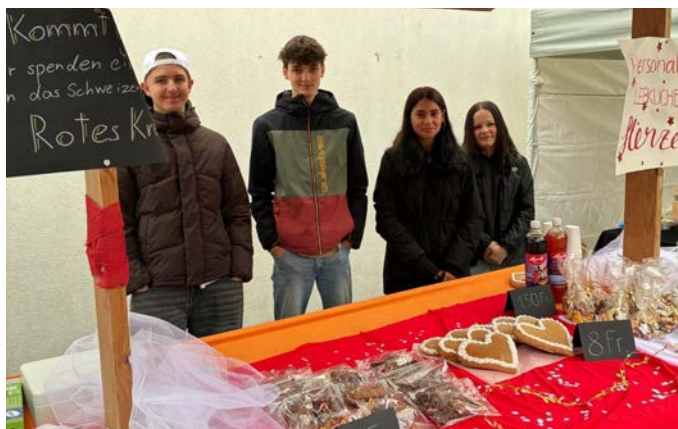
Feines für einen guten Zweck