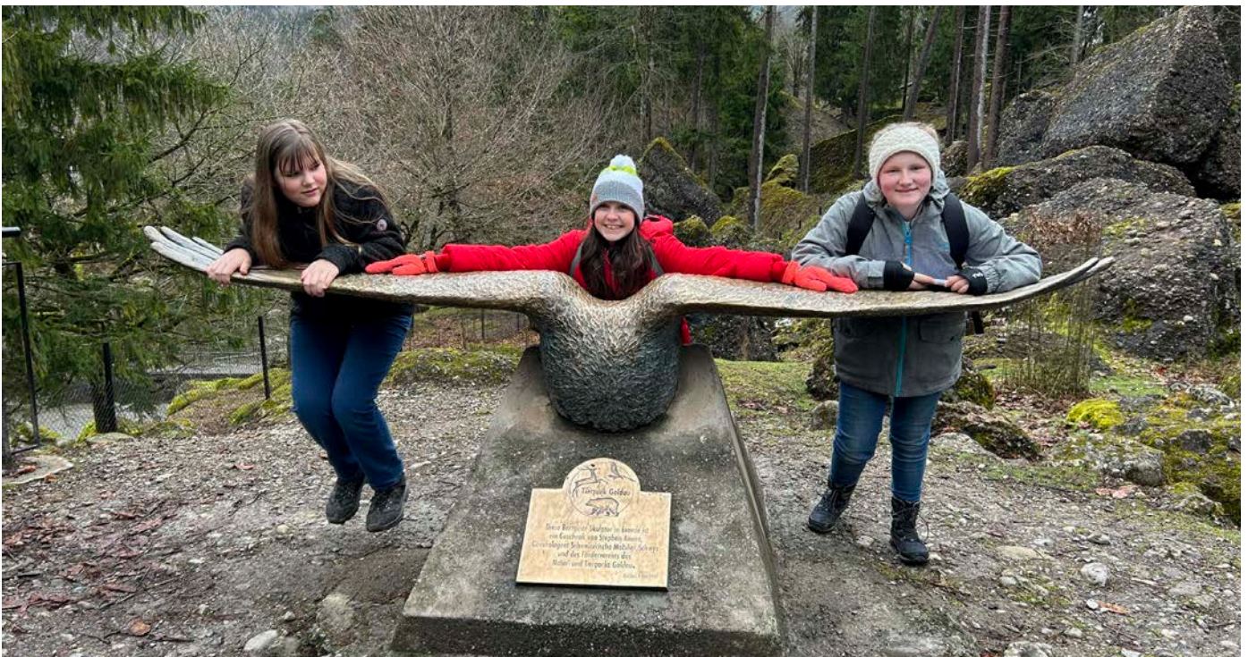
Was? So gross ist die Spannweite des Bartgeiers!