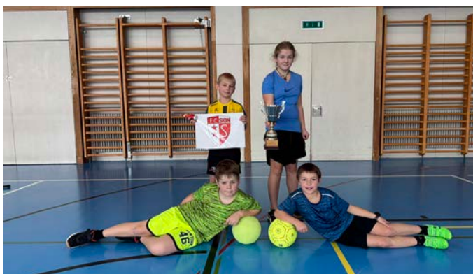
Die Siegermannschaft im Fussball