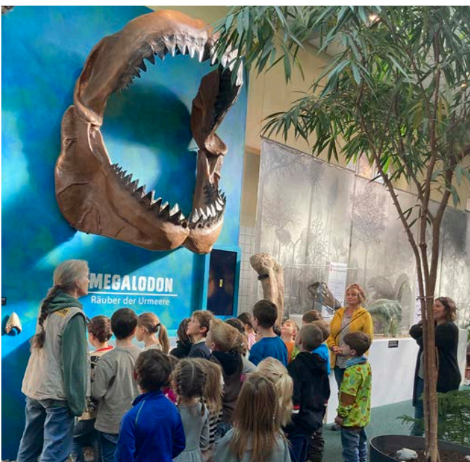
Was für ein Gebiss!