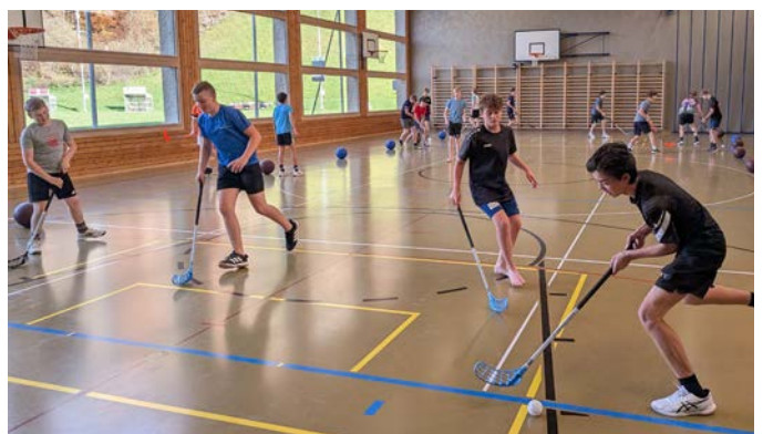
Sportunterricht mit den Knaben der 3. OS (Bild: ms)