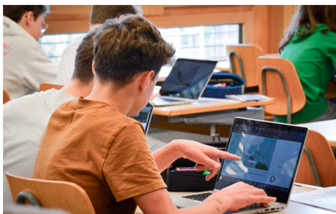
Arbeit an einem Auftrag am eigenen Laptop