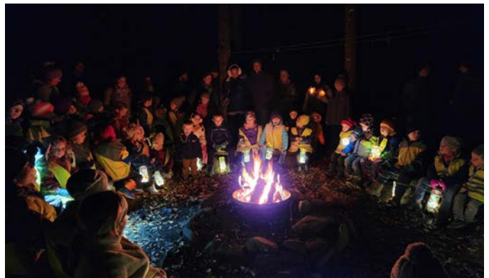
Kleine Lichter leuchten ganz gross